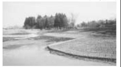
十和田市一本木沢